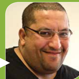
TEGARE, 43 ans

J'aime beaucoup travailler avec l'ordinateur, internet, le scanner... Il faut réfléchir et on apprend tous les jours. J'apprécie aussi le travail en équipe, le partage des tâches, la recherche de l'efficacité. Ce qui me plaît à l'EIA, c'est que l'on tient compte de notre handicap. Cela nous permet d'avoir un travail, d'être occupé la journée, et de nous sentir utile.